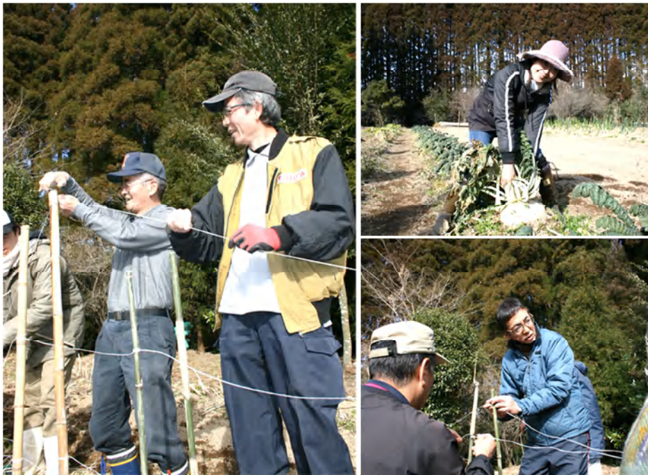
公共職業訓練『農業人材育成科』：野菜栽培実習