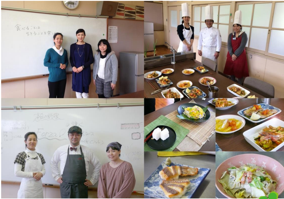
＊短期集中特別訓練～調理補助員養成科 修了式～

短期集中特別訓練「調理補助員養成科」が1ヶ月間の訓練を終え修了式を迎えました。学校初の試み、調理の職業訓練。今後の皆さんの活躍に期待です！【筆者】東 拓希